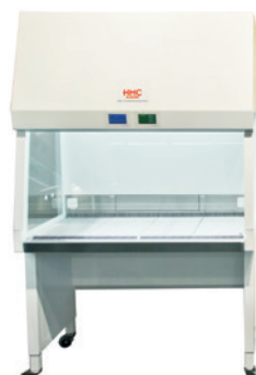
HMC Safeguard Pro 1200 Der Klassiker

Ideal für anspruchsvolle Arbeiten auf engstem Raum